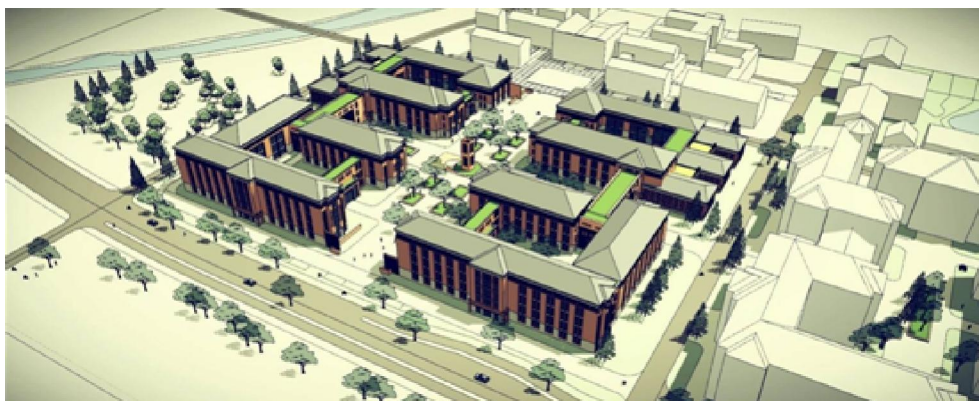
公共教学楼鸟瞰图

与使用单位（机械系）多次对接，协调设计，进行建筑方案修改。完成公共教学楼方案调整。